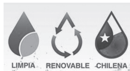
Figura N° 2 Campaña de HidroAysén.

Sobre esta base que mezcla elementos técnicos con naturales, se desarrolla un tercer elemento discursivo que apela al nacionalismo y a la independencia energética; de esta manera HidroAysén se presenta a sí mismo como “un proyecto chileno” (Salazar, 2008), ya que pertenece en un 70% a Colbún, a las fondos de pensiones y a ENDESA (Fernández, 2011). Así se pretende reducir las críticas