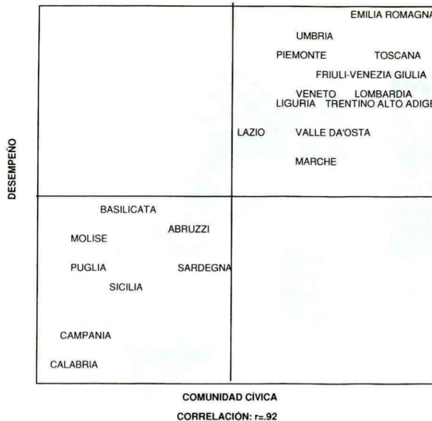
GRÁFICO N° 3 MATRIZ DE COMUNIDAD CÍVICA Y DESEMPEÑO INSTITUCIONAL EN LAS REGIONES ITALIANAS ENTRE LOS AÑOS 1978 Y 1985. (PUTNAM, ROBERT: OP. CIT., P. 98) EN LA MATRIZ SE FORMAN DOS GRUPOS DE REGIONES CON MUY DISTINTO RESULTADO. EN AMBAS VARIABLES, AL DISTRIBUIR LAS REGIONES ITALIANAS CONSIDERANDO LAS VARIABLES DE DESEMPEÑO INSTITUCIONAL Y DE COMUNIDAD CÍVICA, SE DA UNA CORRELACIÓN TAN ALTA QUE PERMITE AFIRMAR CON TRANQUILI- DAD QUE MIENTRAS MÁS CÍVICA ES UNA REGIÓN, MÁS EFICIENTE ES SU GOBIERNO.