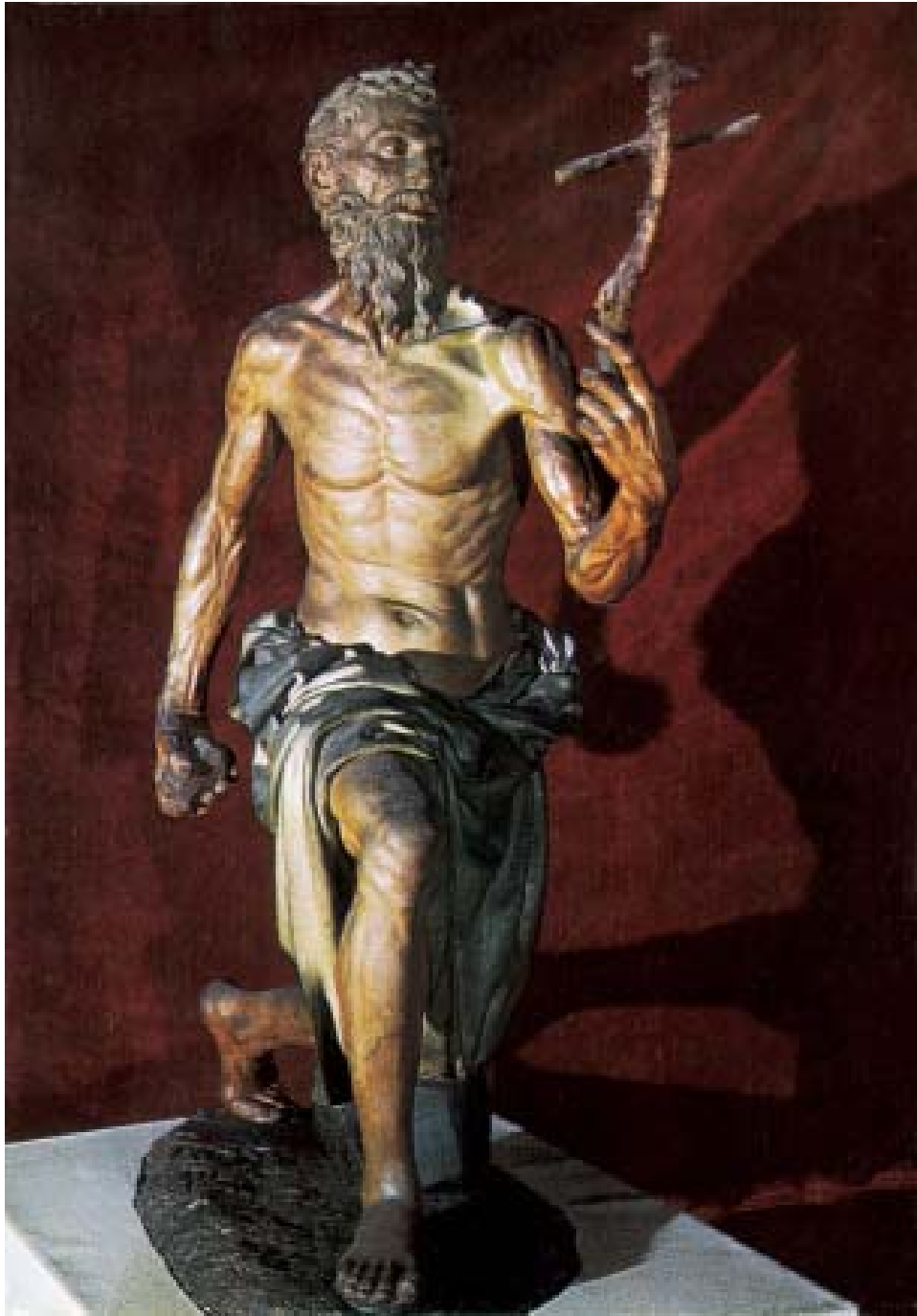
Grabado 12: Nº 359 Sevilla, Museo de Bellas Artes - San Jerónimo (Pedro Torrigiano).