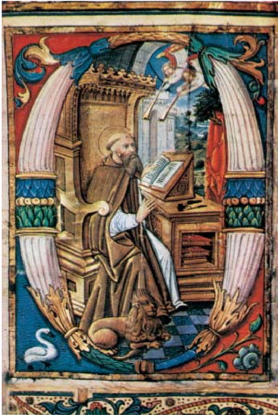
Grabado 5: Códice medieval - San Jerónimo en su estudio.