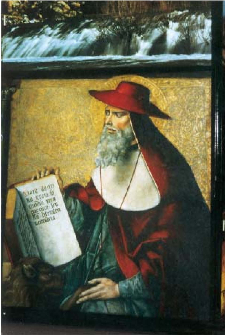
Grabado 1: S. Jerónimo, P. Banquete - Catedral de Avila.