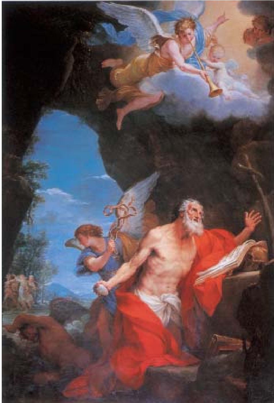
Grabado 11: Roma - Basilica di S. Eustachio - S. Girolamo.